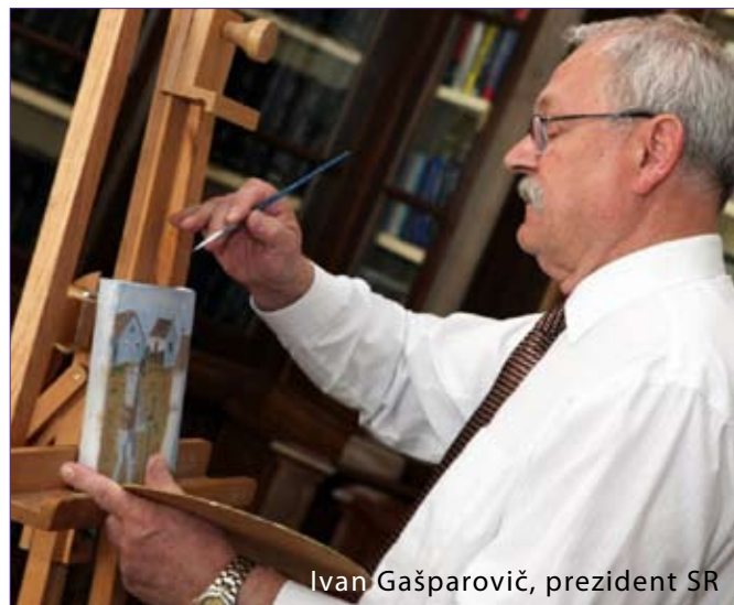
Ivan Gašparovič, prezident SR