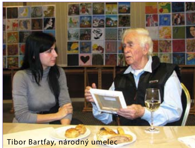
Tibor Bartfay, národný umelec

Pýtate sa, čo tým chcem dokázať? Chcem vytvoriť najväčšiu galériu svojho druhu na svete, a nielen to.